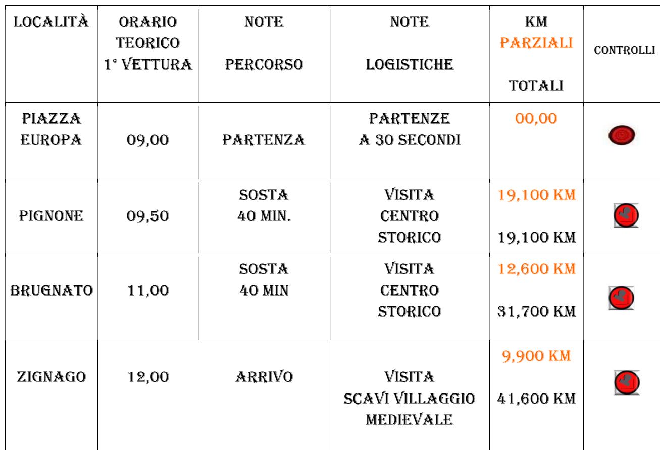
TABELLA DISTANTE TEMPI